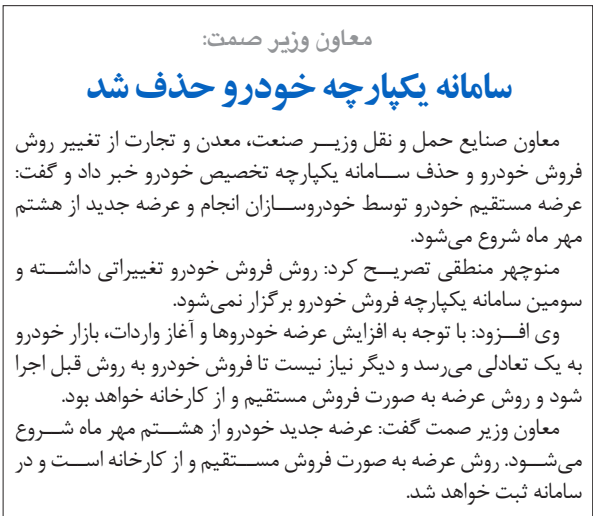
معاون وزیر صمت: